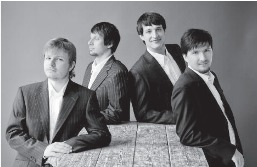
Apollon Musagète Quartett

KONZERT SONNTAG, 25. AUGUST 2024 17.00 UHR