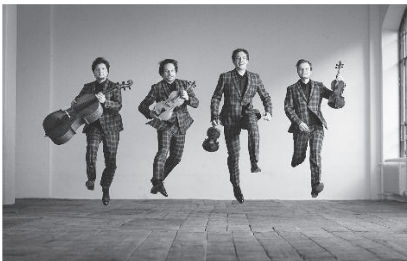
Apollon Musagète Quartett

KONZERT FREITAG, 23. AUGUST 2024 20.00 UHR